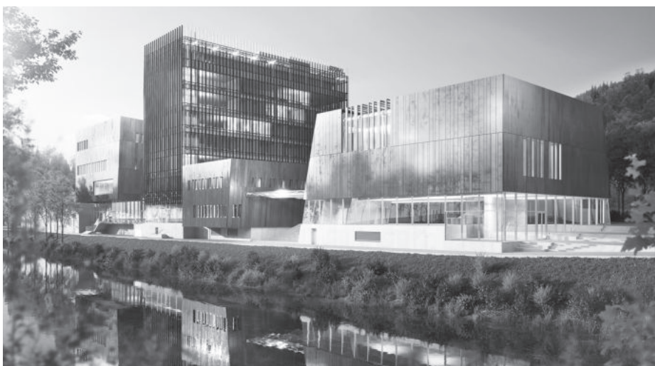
A cég székhelyén, Waiblingenben épülő bemutatóközpont

A mikor a cég alapítója, Andreas Stihl az 1920-as évek közepén azt tapasztalta, hogy az erdőgazdálkodásban leginkább fejszével és izomerővel végzik a munkát, nem tudott szabadulni többé a gondolatától: »Bizonyosan létezik megoldás az erdei munka egyszerűbbé tételére.« A gondolatból ötlet, az ötletből találmány született... A STIHL név több mint 90 éve egyet jelent a kiemelkedő innovációkkal, a minőségi termékekkel és a teljes körű