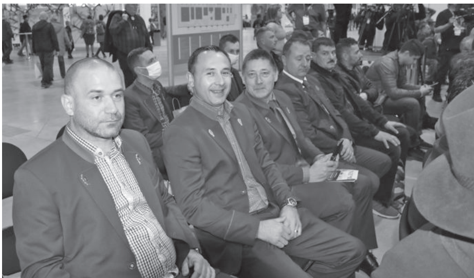
A küldöttség néhány tagja