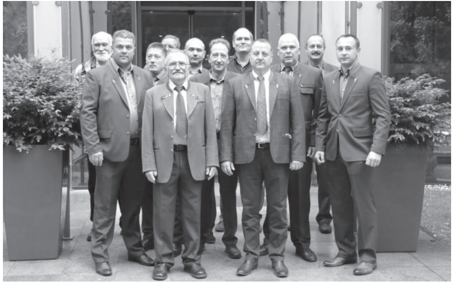
A küldöttség tagjai és a vendéglátók

Október 7-én, csütörtökön, az „Egy a Természettel – Vadászati és Természeti Világkiállítás”-t kereste fel a delegáció, ahol a szakmai nap a román szakminisztérium szervezésében zajlott. A program a vásár területének feltérképezése során a rendkívül látványos bemutatók megtekintése mellett a baráti beszélgetések helyszínének is tökéletesen megfelelt.