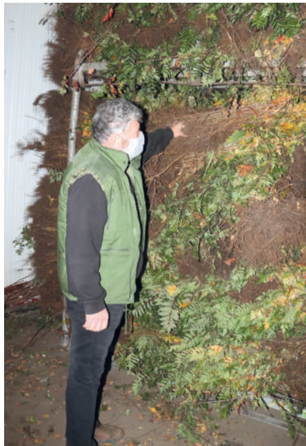
Csemeték a hűtőházban