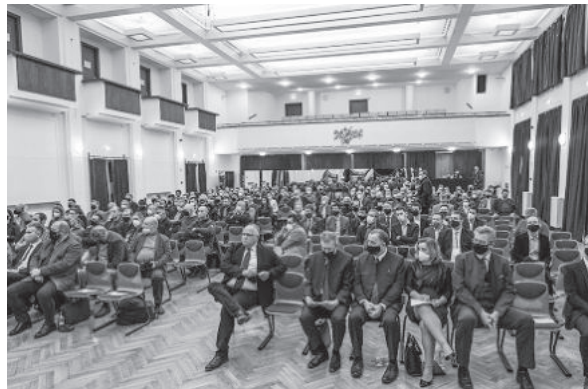
A konferencia hallgatósága

A Soproni Egyetem Erdőmérnöki Kara és Erdészeti Tudományos Intézete 2022. február 10-én Erdészeti Tudományos Konferenciát tartott, amelynek középpontjában az erdők fenntartható kezelése és a klímaváltozás hatásaira adható tudományos válaszok, kutatási eredmények